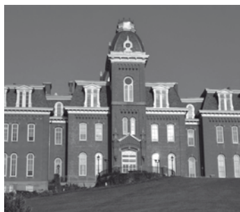
"West Virginian University"