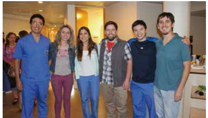
Alumnos de Post-Grado