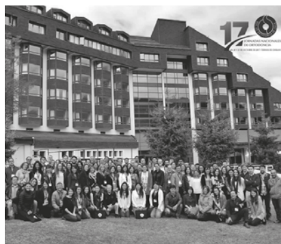
Jornadas Nacionales de Ortodoncia, Termas de Chillán